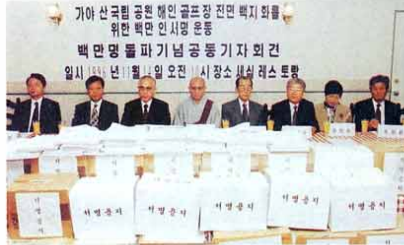
○해인골프장 건설 반대 서명운동이 4개월만에 1백만명을 돌파, 발족인대책위는 기자회견을 갖고 해인골프장 건설계획의 백지화를 촉구했다.

한편 발족인대책위는 해인사 관전 및 관안대장경의 세계문화유산 지정 1주년을 맞는 오는 12월9일 KOMOS(세계문화유산 기술자문회) 관계자를 초청, 기자회견 및 정부당국을 방문할 계획이다. <정성운 기자>