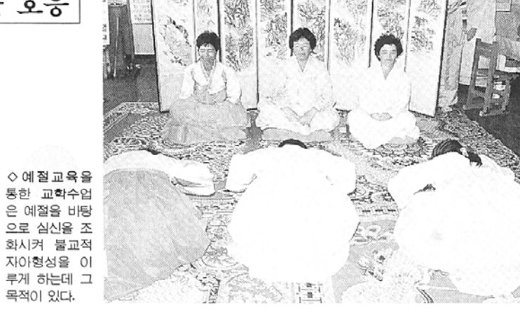
◇ 예절교육을 통한 교학수업은 예절을 바탕으로 심신을 조화시켜 불교적 자아형성을 이루게 하는데 그 목적이 있다.

위한 예절교육방안'이라는 논문을 통해 발표. 참석한 각 종립 학교 교법사들의 관심을 끌었다. 이 자리에서는 종립학교 교학수업의 중요성으로 학습내용의 습득뿐 아니라 사회에서 예절과 사회규범 그리고 조화와 질서의식을 배우는 것을 꼽았다. 또한 종교의 이론습득과 체험도 중요하지만 예절을 바탕으로 심신을 정화시키고 습득해 나가는 과정에서 자연스럽게 불교적 자아형성을 이룰 수 있다는 결론을 도출했다. 이처럼 청담종교 예절교육은