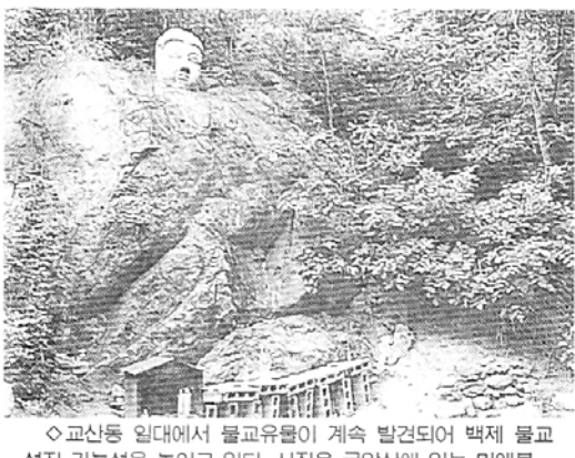
교산동 일대에서 불교유물이 계속 발견되어 백제 불교 성지 가능성을 높이고 있다. 사진은 금암산에 있는 마애불.