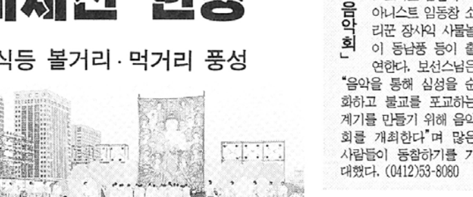
◇여의도 특설무대에서 육법공양의식이 봉행되고 있다.

여의도광장 1만여명을 볼국 정점으로 장엄한 ‘불교문화대제전’이 지난 5일 그 모습을 드러냈다. 흥겨운 풍물패의 길놀이와 필두로 젊은 음악합창단의 자비의 노래 음성공양, 타종과 함께 장내 아나운서의 개회선언으로 본 채도에 오른 이번 행사는 오는 14일까지 문화관, 역사관, 생활관, 공연장으로 나뉘어 불교문화전시 및 각종 이벤트를 매일 마련, 불교잔치 한마당을 연출한다. 한종일 삼국불교교류회의에 맞춰 삼국불교의 발전과정을 시대별로 전시한 역사관, 불교 미술인들의 개인전으로 꾸며지는 미술관, 조계 태고 천대 조각 조동종 등 각 종단의 역사와 현황을 보여주는 종단관을 비롯 영상관에서는 매일 불교영화 불교TV 제작프로그램이 상영되고, 공예품관과 사찰음식관에서는 불교관련 공예품 전시와 사찰음식 조리과정, 시식행사 등이 마련된다. 이밖에도 영산재, 전통화혼식, 육법공양 시연, 참선지도, 중국 소림사 무승단과 한국 불교선법 무술시범, 판소리 불타전 등 다채로운 일정으로 진행될 예정이다.