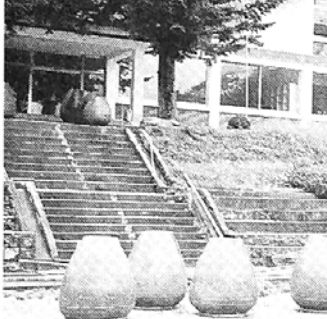
◇ ‘해인사문화관’으로 탈바꿈 되는 구 해인초등학교의 전경 모습. 운동장은 추후 조각공원으로 꾸며질 예정이다.