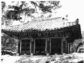
도솔암 절내 도솔암 내원공