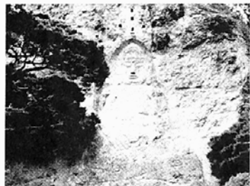
도솔암 절내 보물 제1200호 마애석불