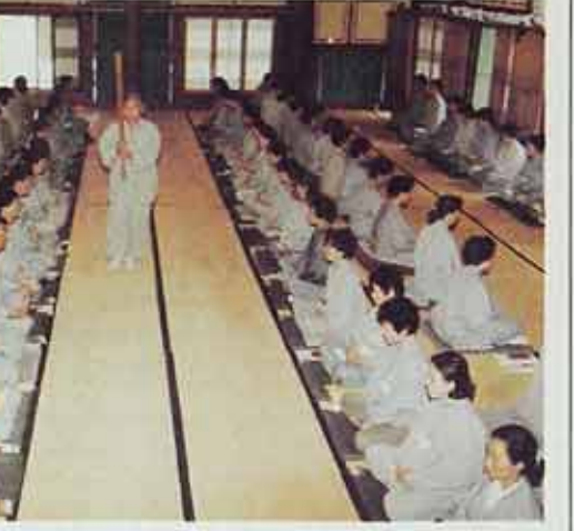
◇교구본사마다 수련대회를 개최해 참여기회를 확대해야 한다는 요구가 일고 있다. 사진은 올해로 28회째를 맞는 송광사 수련대회 모습.

“지금도 참가할 수 있겠으나, 횡수를 늘려달라고 요구하는 전화문의가 쇄도하고 있다. 아예 입제식에 맞춰 찾아와 담당자들을 곤혹스럽게 하는 경우까지 있다”고 말했다. 내년에도 다시 송광사 수련회에 신청서를 제출하겠다고 밝