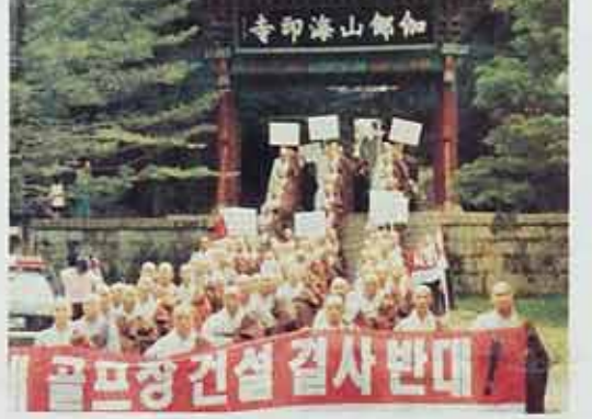
◇해인총림 스님들이 산중총회를 갖고 해인골프장 백지화를 요구하며 진압로에서 가두행진을 펼쳤다.

또 상설수련원의 건립이다. 송광사는 상설수련원 건립을 계획하고 있지만, 예산부족 등의 어려움으로 몇 년째 미뤄오고 있다. 대운사도 수련원 건립을 계획하고 있다. 소규모이긴 하지만 문경수련원(지도법사 법봉, 0581-71-6031) 대원사의 조계종 총무원 기획실 관계자는 "포교효과와 대사회 기여 등을 고려해 본사급 사찰은 가능한 수련대회를 개최하도록 권장하고 있다"고 밝혔다.