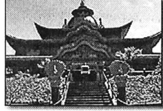
캘리포니아 북쪽 스투어트 포인트 인근 아산에 건립된 '오디안'의 황금빛 본당.

기능을 통해 사찰은 그 관리와 사업계획수립에 적절하게 사용할 수 있다. 지금까지 시중에 나와 있는 사찰관리 프로그램을 살펴보면 도스용으로 제작돼 최단판넬 것으로 알려진 '아나타'를 비롯, 역시 도스체제로 발매됐다가 최근 원도95체제로 확장 재발매된 '보리수' 등이 있다. <은>