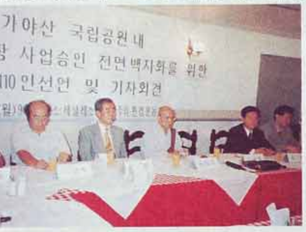
가야산 국립공원내 당 사업승인 전면백지화를 위한 110인선언 및 기자회견