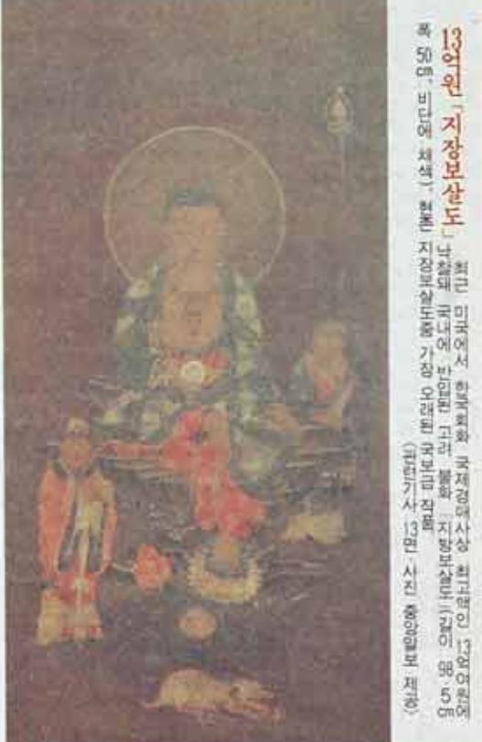
13인원 '지장보살도' (국립중앙박물관 소장)

한편 관람료인상에 따라 △안 내원 고장재치 △사찰 소개 영상물 상영 △안내관 정비 등 사찰 참배객을 위한 서비스개선이 뒤따라야 한다는 목소리가 높다.