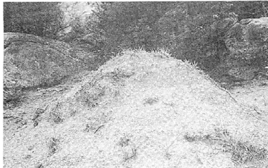
삼릉계곡 마애관보살상 서쪽에 있는 불법분묘. 전지도 입하지 않아 흉물스럽다.