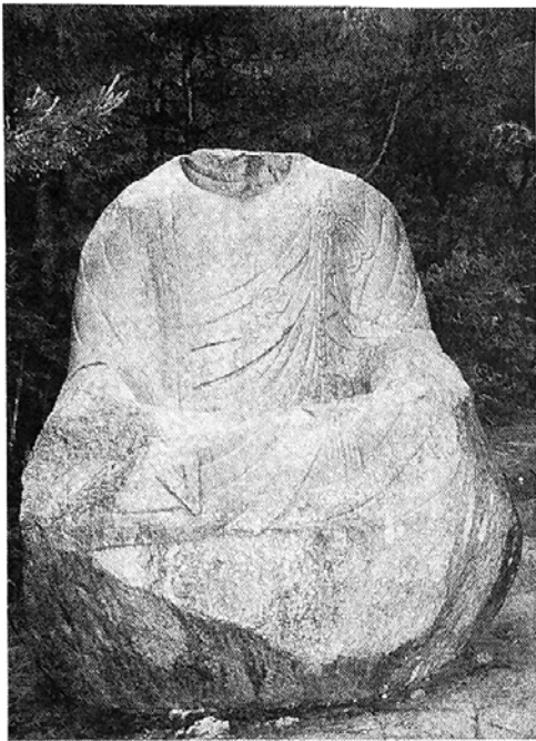
머리없는 불상 상대만 온전했다더라면 국보급으로도 손색이 없을 것이라는 아쉬움을 주는 불상 여러 좌상. 가사끈 매듭의 빼어난 조각 솜씨가 돋보인다.