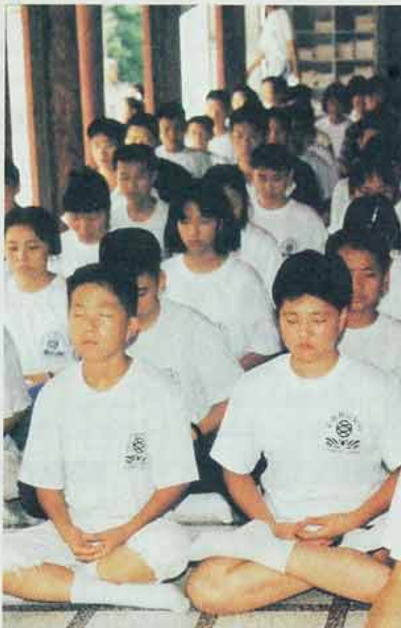
◇어린이 마음은 부처님 마음. 이처럼 깨끗하고 맑은 심성을 지닌 새싹불자들은 미래불교를 일궈갈 주인공들이다. 이들에게 자비로운 부처님 미소와 함께 유익한 프로그램으로 수행을 돕는다면 불국토의 세상은 밝게 열릴 것이다.