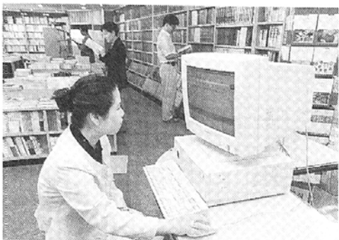
▷ 책방 여시아문은 지난 3일부터 인터넷 '사이버 책방 여시아문' 서비스를 제공하고 있다. 인터넷과 연결된 컴퓨터로 집에서도 직접 이용할 수 있다.