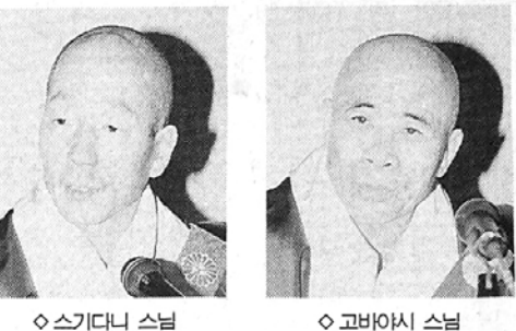
스기다니 스님, 고바야시 스님

"한·일 천태종은 법형제입니다. 일본에 불법을 전해준 한국을 첫 방문에 기쁘게 생각합니다. 이번 방문을 계기로 한·일 우호와 세계평화를 위한 새물꼬를 댔다고 봅니다." 일본 천태종 총무원장 스기다니 기조스님과 총본산 히에산 연력사 집행 고바야시 류조스님이 지난 15일 내한하여 17일까지 천태종 총본산 구인