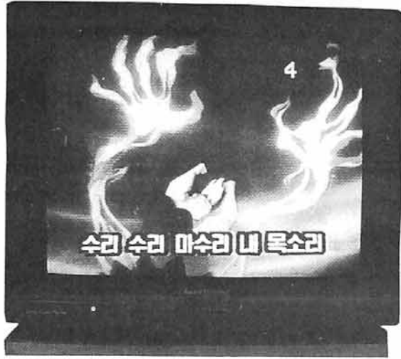
◇디즈니 만화영화 '인어공주'의 화면. 자막에 마녀주인이 수리수리 마수리로 번역돼 있다.