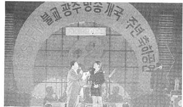
◇광주 구동실내체육관을 가득 메운 5천여 관중들은 광주불교방송 개국 1주년을 노래와 함성으로 축하했다.

에서는 하이텔이나 천리안 같은 PC통신에 방송사 및 프로그램 관련 메뉴를 만들고 방송제작과 시청자 방송 참여를 활발히 해오고 있다. 따라서 불교TV PC방 개설은 멀티미디어 시대에 시청자들의 다양한 욕구를 충족시켜 주고 방송의 제작 영역을 넓힌다는 취지에서 바람직한 현상으로 받아들여지고 있다. 불교TV PC방은 하이텔에서 GO BTN으로 들어가면 된다. <은>