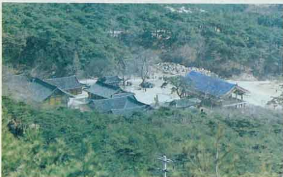
◇ 한국선종의 종가이자 친란한 백제문화의 본산인 조계종 제7교구본사 수덕사는 국내 유수의 수선도량(修禪道場)으로 많은 후학들을 배출해 오고 있다.