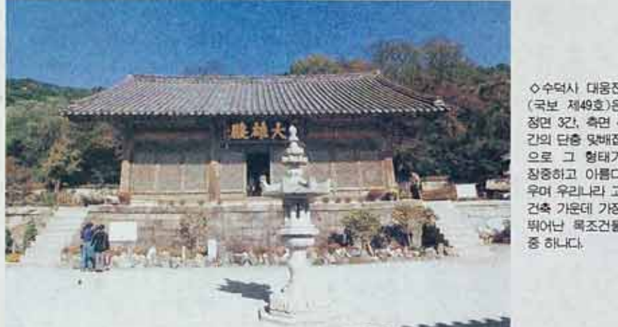
◇ 수덕사 대웅전(국보 제49호)은 정면 32칸, 측면 4칸의 단층 맞배집으로 그 형태가 정중하고 아름다우며 우리나라 고건축 가운데 가장 뛰어난 목조건물 중 하나다.