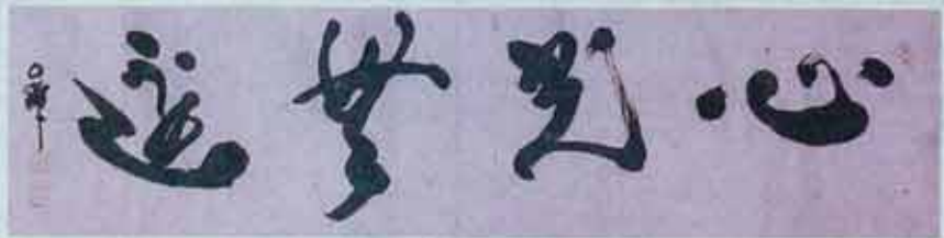
◇ 방장 원담스님 휘호 <心光無邊>

불교는 나 자신이 나를 깨닫는 법이지 부처를 믿는 것이 아닙니다. 때문에 우리들에게 '나'를 찾을 별도의 장소가 필요하지 않습니다. 믿는 사람이 필요없고 형식이 필요없습니다. 비록 절이 아니더라도 좋습니다. 아무도 믿어주지 않는 어느 처마 밑이라도 상관없습니다. '나'란 존재는 어디에나 있으므로 시간과 장소를 불문하고 '나'를 찾기 위해 정진할 수 있습니다.