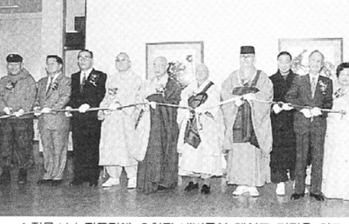
◇정목스님 작품전에 초청된 내빈들이 테이프 커팅을 하고 있다.