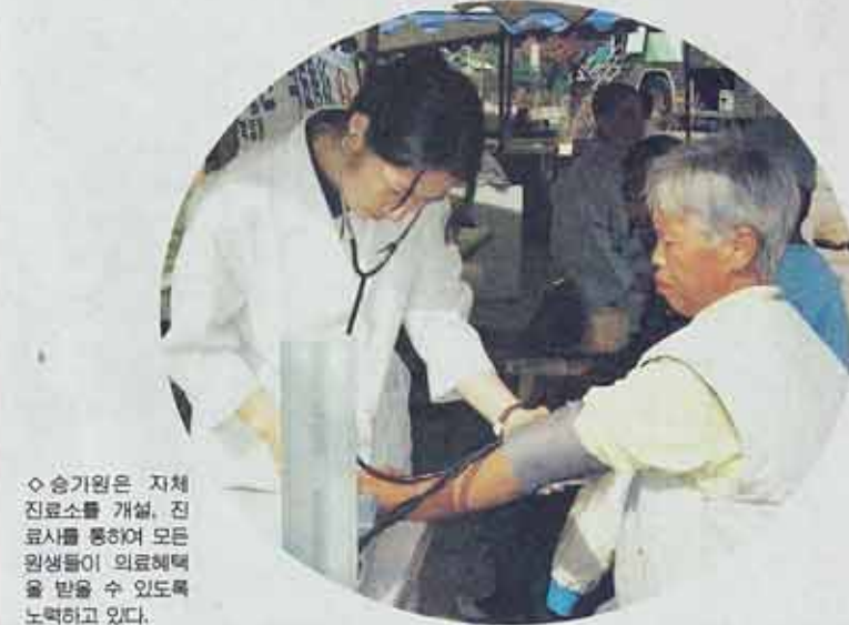
◇승가원은 자체 진료소를 개설, 진료사를 통하여 모든 원생들이 의료혜택을 받을 수 있도록 노력하고 있다.