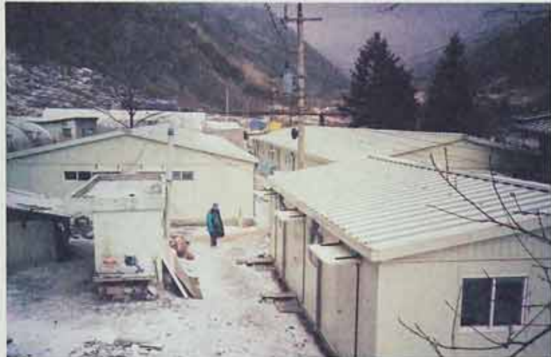
◇소쩍새마을이 새롭게 단장됐다. 사회복지법인 승가원은 비가 새고 냄새나던 율목시설을 총 4개 동 1백80여명의 단층조립식 건물로 개축하고 구립 26일 완공식을 가졌다.