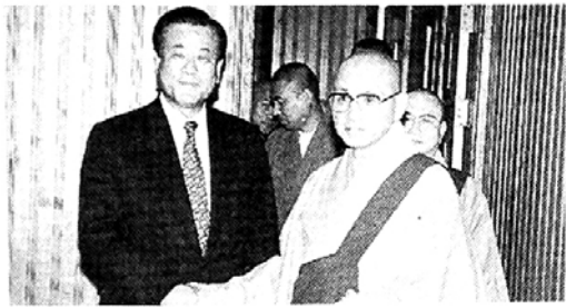
김우석 내무장관 월주스님 예방

송길주 조계종 총무원장은 지난 5일 김우석 신임 내무부 장관의 신년예방을 받고 국립공원관리공단 통합장수 및 공원 입장료 30%를 문화재 보수비로 지급할 것 등 교계 현안문제 해결을