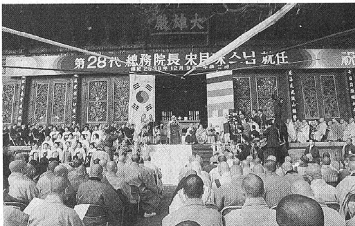
◇ 조계종 개혁종헌에 의해 출범한 개혁집행부가 1년을 맞았다. 사진은 지난해 12월 9일 종무원장의 취임식 장면.