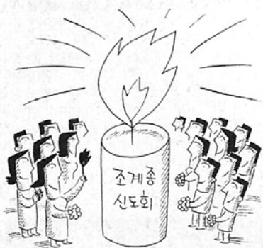
어두운 곳이 많은 이대에...