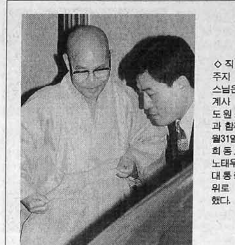
◇ 직지사 주지 녹원스님은 파계사 주지 도원스님과 함께 10월31일 연희동로 노태우 전 대통령을 위로 방문했다.

다. 하지만 이같은 후원에도 불구하고 나눔의 집 공사를 완료하기까지는 아직도 많은 기금이 소요될 것으로 보여 불교계의 많은 관심과 지원이 필요한 것으로 알려지고 있다. 불교인권위 장기수 복송회담 무산 불교측과의 만남은 월주스님 방북 무산이후 또다시 원점으로 되돌려졌다. 한편 인권위는 창립 6주년을 맞아 오는 20일 오후 6시 인권법당 김상사에서 김근태(국민회의 부총재)씨등을 초청해 창립기념식 및 강연회를 연다.