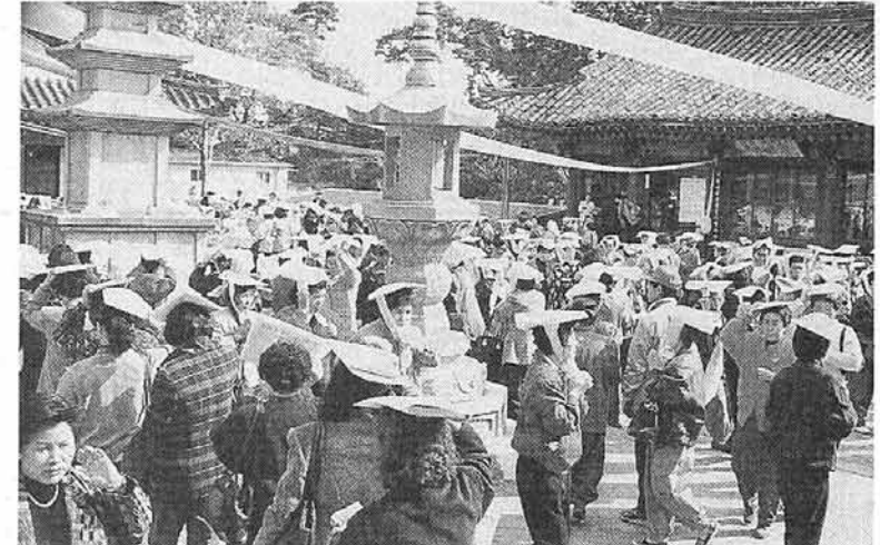
보우대사 문화재 봉행 서울 강남구 봉은사 남문에서 열린 대웅전에서 8쌍의 부부가 무로합동결혼식을 올리고 11월11일 1천여 불자가 참석한 가운데 정대불사를 봉행했다. 이번 문화재기에는 10월31일 대웅전에서 8쌍의 부부가 무로합동결혼식을 올리고 11월11일 1천여 불자가 참석한 가운데 정대불사를 봉행했다. 또한 봉은사는 경내에서 소년소녀가장들이 우리농산물 일일장터를 열었다.

항이다'고 답변 반면에 20.2%만이 '종단개혁을 위한 구중의 선택이었다'고 응답해 대부분의 응답자가 구중법회의 취지에는 동의하지만 과정에 있어서는 의견이 엇갈리고 있다. 총무원의 바람직한 대정부관계의 질문 사항에 58.7%가 '정부로부터 지주성이 이루어지지 않고 있다'고 응답, 종단과 정부간의 관계를 어떻게 설정할 것인가하는 문제가 현 집행부의 주요한 과제로 제기되고 있다. 또 민주성 여부를 묻는 질문에는 '아직도 비민주적이므로 소가 산재해 있다' 41.6% 등 부정적인 견해를 보이고 있는 것으로 나타났다.