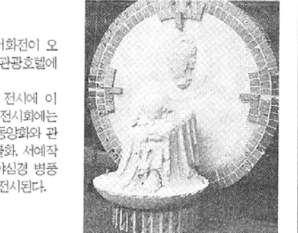
◇ 배호남씨의 '성연의 세월'.