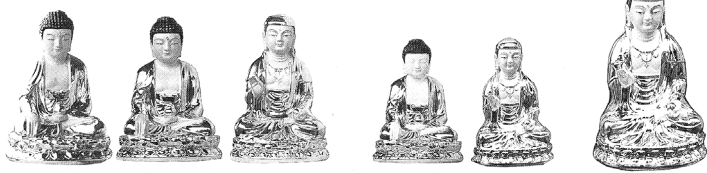
(7저 : 23.1cm)