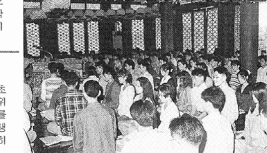
동국대 학생들이 정각원에서 선실습을 지도받고 있다.

실습강좌에는 먼저 선에 임하는 마음가짐, 선의 의미, 선의 자세 등에 대한 이론강의에 이어 곧바로 참선실수에 들어간다. 지도교수 해원스님의 촉비 소리에 맞춰 허리를 곧게 세우고 눈을 지그시 감으며 마음을 가라앉혀 고요한 삼매에 든다. 이렇게 참선실수가 시작되면 정각원은 곧 선실이 되고 학생들은 스님 못지 않은 수행자가 된다.