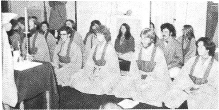
◇ 흥법원을 근거로 미국 포교의 결실이 이어가는 가운데 미국인 제자가 출가를 하기도 했다. 사진은 법회에서 설법을 듣는 미국인 제자들.