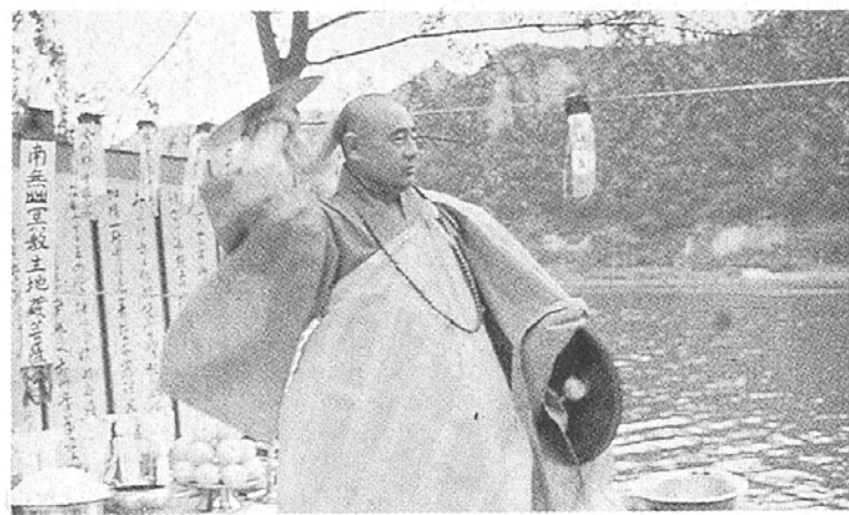
▷ 생전예수재 의식중에 펼쳐지는 바라춤.

재(齋)로서, 속설에는 자신의 49재를 미리 지내는 것이라고도 한다. 그래서 다른 말로 역수(逆修)라고도 한다. 사람이 죽은 후에 다른 사람들이 그를 위해 아무리 열심히 기도하고 재를 성대하게 지내 그 사람의 사후 복락과 극락왕생을 기원한다 할지라도 그 공덕은 실제 재를 지내는 당사자에게 대부분 돌아가지 죽은 사람에게는 별다른 도움이 되지 못한다. 예수재는 불교 수행의 근본 입장인 자력해탈(自力解脫)의 성격을 충실하게 반영하면서, 불보살과 호법신중의 가피력 아래 스스로의 정성된 수행으로 자신의 미래를 닦아가는 의례이다.