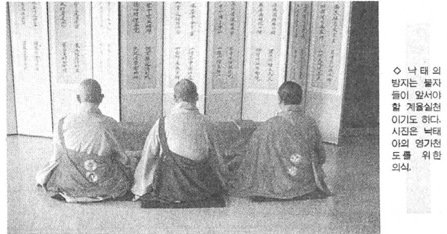
◇ 낙태의 방식은 불자들이 앞서야 할 계율실천이기도 하다. 시집은 낙태아의 영가천도를 위한 의식.

이 가운데 이 세상에 태어나기 이전의 영혼인 중유(中有)는 공중에서 부모의 인연을 만나서 출생하고자 하는 욕망을 갖고 있다. 그리고 태아의 전생 업력(業力)이 출생에 영향을 미쳐서 업력이 비슷한 부모를 선택하게 된다. 전생의 영혼인 중유는 전생에 지은 업력에 의하여 출생처를 정하여 태어나게 된다. 그리고 인간이라는 과보를 형성하게 된다. 이때 전생의 업력은 인(因)이 되고 부모는 연(緣)이 되어 생유라는 결생(結生)을 한다. 태아의 성장 과정은 팔위설(八位說)과 오위설(五位說)로 설명된다. 이는 태아가 모태에서 자라는 동안에 오장육부와 눈, 코, 귀, 입 등 인간의 형태를 갖추어 태어나기까지의 기간