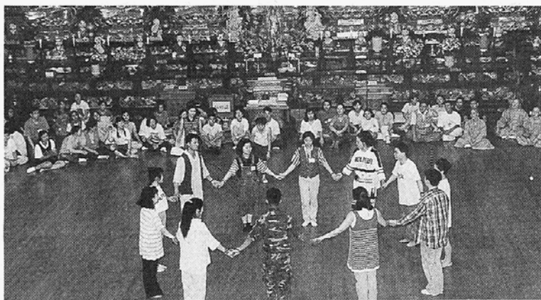
◇ 교계 교육기관에서 양성된 불교레크레이션 지도자들은 올 여름 캠프진행을 위해 분주하게 보내고 있다.

려지고 있다. 특히 역사기행, 국토순례, 체육캠프, 가족캠프등은 청소년과 가족들이 함께 참여할 수 있어 잊혀져가는 가족우리의 재고에도 큰 역할을 할 것으로 기대되고 있다. 환경문제의 심각성을 일깨우는 환경캠프와 도전과 의지력을 길러주는 국기캠프도