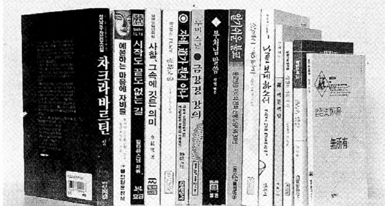
◇상반기 베스트불서 집계 결과 수행입문서가 꾸준한 인기를 얻고 있는 것으로 나타났다.

의 한 전형을 보여주는 책으로 평가된다. 이와함께 <진리의 말씀> <부 처님말씀>이 베스트15에 들어 경전에 대한 선호도가 여전히 높게 나타났다. '불일소책'으 로 퍼낸 <진리의 말씀>은 대승 불교의 대표적 경전인 법구경 을 우리말로 옮긴 것으로, 법 정스님의 깔끔한 번역이 돋보 인다. 84년 초판이후 꾸준한 인 기를 얻고 있다.