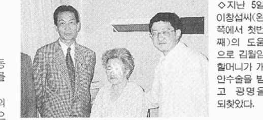
어둠속에서 살고 있는 것이 안타깝다"며 "부처님 가르침을 조금이라도 실천하고자 노인 개인수술을 돕고있다"고 말했다.

분규사찰의 대명사격인 봉원사의 총 면적은 13만1천382평이며, 향후 택지로 전환, 활용할 수 있는 면적은 3만평 정도 되는 것으로 드러났다. 조계종 「조·태 분규사찰특