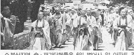
부산지역 승·재가단체들은 6일 범어사 앞 아파트 건립 반대 켈기대회를 열었다.