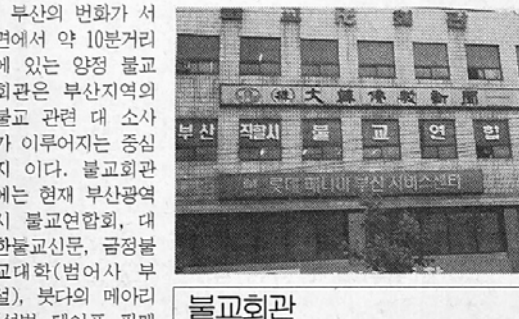
부산의 변화가 서면에서 약 10분거리에 있는 양정 불교회관은 부산지역의 불교 관련 대 소사가 이루어지는 중심지이다. 불교회관에는 현재 부산광역시 불교연합회, 대한불교신문, 금정불교대학(범어사 부설), 부타의 메아리(설법 테이프 판매

민을 대상으로 한 통계청 조사에 불교신자 비율 27.7%를 훨씬 앞서는 수치이다. 이것만 보더라도 부산은 가히 불교도시라고 해도 손색이 없을 정도이다. 현재 부산에는 조계종을 비롯하여 26개 종단 및 재단법인이 등록된 사찰과 미등록 사찰을 통산하면 약 1천여개 이상