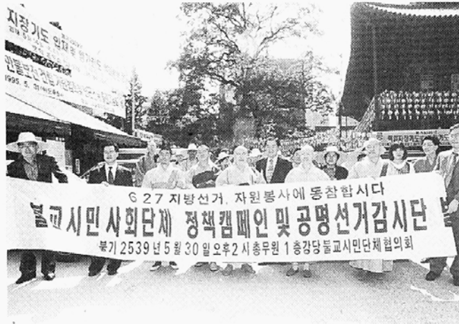
6.27 지방선거 자원봉사에 동참합니다 불교시민사회단체 정책캠페인 및 공명선거감시단 부기 2539년 5월 30일 오후 2시 총무원 1층강당 불교시민단체협의회

하다는데 있으므로 방송인 스스로 종교적 신심에 투철해야 할 것이다. 둘째로, 정보사회로 변화하는 현대사회의 추세를 방송에 정확하게 반영함으로써 정보사회의 총인방들이 명실상부한 시대의 선구자가 될 수 있도록 하여야 하며, 결과적으로 불교의 정보사회적 적응과 혁신을 선도해줄길 바란다. 셋째로, 우리나라의 불교사회가 종교적 공동체로서 유대감을 가지고 도반의 정진을 갖출 수 있도록 불교인의 연결망 역할을 할 수 있어야 할 것이다. 개국5년에 전국망 구축, 여기서 BBS는 거듭나야 한다. 이러한 과제 앞에 교계의 현안인 '불방사태'는 하루속히 매듭지어져야 한다. 그에 이은 그간의 경험을 도약의 발판으로 삼아 '개혁의 소리, 나누는 기쁨'을 전국 방방곡곡에 전할 수 있겠다. 이 대작사를 위해 BBS와 불교계는 세계최초의 불교방송 설립에 가슴 설레던 그 마음으로 돌아가야 한다.