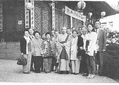
◇전문직에 종사하는 정목회 회원들은 요즘 육조단경등 경전공부에도 힘친다.

뿐만아니라 정목회는 매년 봄, 가을 2회에 걸쳐 정기적으 로 보육원, 무의탁 양로원등 복지시설을 방문, 자애로운 부 모도 되고 때로는 응석부리는 아들로서 뜻밖의 가족의 정을 느끼게 해준다. 더욱이 질병에 대한 저항력 이 약한 노인들에게는 건강오 법을 일일히 지도해 주고 있어 정목회가 찾아오는 양로원 노