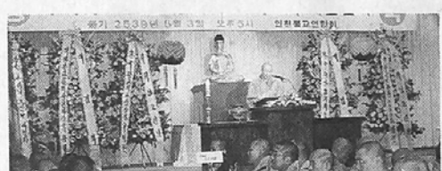
인천 불교지도자 봉축기원 법회