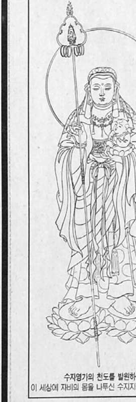
수자영가의 천도를 발원하여 이 세상에 자비의 물을 나누신 수자지정보살(사부후)

대원사는 백제 무녕왕 3년(서기 503년) 아도화상이 창건한 백제 고찰입니다. 수자지정보살(水子地藏菩薩)을 봉안하고 수자영가의 천도를 기원해온 대원사에서는 수자영가의 천도 및 생전 예수재를 위한 제4차 100일 미타기도를 봉행합니다. 수자령이란 부모와 인연은 맺어졌지만 이 세상의 햇빛을 보지 못하고 죽어간 불쌍한 어린 영혼들을 말합니다. 수자영가의 천도를 봉행하는 목적은 첫째, 씻을 수 없는 부모의 죄업을 참회하여 안경과 평화의 마음을 갖게 하고 둘째, 전생과 금생의 나쁜 인연을 소멸시켜 삶의 고통과 장애로부터 벗어나며 셋째, 원결 맺힌 영가들을 해탈시켜 가정과 사회의 평화를 기원하며 넷째, 불보살의 큰 서원에 의탁하여 대승의 마음 일으켜 삶의 고통과 죄업에 몸부림치는 이웃들의 다정한 벗이 되어 보살의 삶을 실천하고자 합니다. 그리고 금년(을해년) 윤달을 맞아 예수재 의식을 봉행합니다. 생전 예수재(生前 預修)란 자신의 사후(死後)에 행할 49