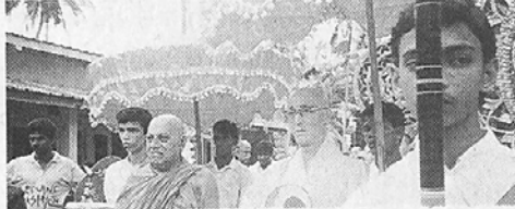
아마라푸라종 담마록카 부승왕 내한

스리랑카 아마라푸라종 담마록카 부승왕이 지난 3일 종단원로스님 5명과 함께 내한했다. 담마록카 부승왕은 한국 불교여래종에서 주창하는 봉축행사에 증엄법사로 참석하