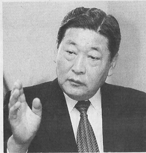
임을 밝혔을때 언행에 주의하고 불자답게 살려고 노력하게 되어 사회가 더욱 밝아질 것 이다"고 강조했다. (이준업 기자)

권회장은 전국사찰을 참배했다. 깊은 산사에 주숙하는 큰 스님들도 친견, 마음을 닦기도 했다. 요즘 김회장은 담담하게 불자임을 밝히는 '불자 실명제'를 주창하고 있다. 권회장은 "명리나 계산적으로 종교생활을 하는 것은 불자의 자세가 아니다"며 "불자