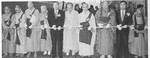
성철스님 추모사진·수묵화 전시

송광사 서울본원 법원사(주지 현호)는 지난 5일 영산대법전 3층 법당에서 상량법요식을 봉행했다. 이날 상량식에는 회광승전(조계총림 방장) 스님, 설정스님(중앙총회 의장), 월탄스님(불교발전연구원 이사장)등 스님과 재가신도 5백여명이 동참했다. 영산대법전은 지난해 2월 4일 기공, 지 3층 지하시2층 연면적 1천2백 50평으로 금년말 완공될 예정이다.