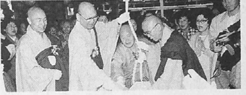
법원사 영산대법전 상량 법요식

월주 조계종 총무원장 스님은 지난 3일 오후 5시 서울시청으로 최병렬 시장을 방문하고 서울시가 원각사지 복원등 불교문화재 관리 및 보수에 각별히 관심을 갖고 지원해 줄 것을 요청했다. 또한 스님은 관악구 청소년회관 위탁 운영에 대해 의견을 교환하고, 지난달 27일 시청앞 평화의 탑 정등 법회에 참석한 데 대해 고마움을 표시했다.