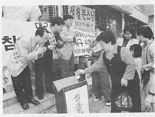
◇지난 7일 부처님 오신 날 조계사 앞에서 있는 대구참사 희생자들을 위한 성금모금에 불자들이 다들 참여하고 있다.