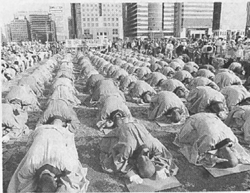
◇다채롭게 펼쳐진 봉축행사는 나름대로의 수확을 거두었으나 기획력이나 참가자의 질서의식은 여전히 아쉬움을 남겼다. 사진은 여의도 법요식 예불장면(좌)과 조계사 경내에서의 사물놀이.

불기 2539년 부처님 오신 날을 맞아 전국에서 다채로운 봉축행사가 펼쳐졌다. 깨달음의 사회화, 자연환경 기리기 운동 등이 전개되는 가운데 개최된 각종 봉축행사는 부처님 오신 뜻을 오늘로 실현시키는데 크게 기여했다는 평이다. 올해의 봉축행사를 점검해 본다. (편집자 주)