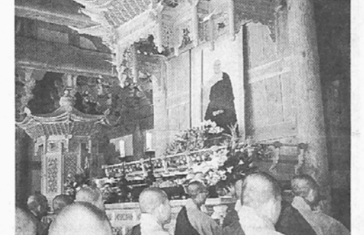
◇MBC가 부처님 오신날 특집으로 방송하는 '성철스님을 찾아서'의 한 장면.

Q체널 석가모니의 발자취 (7일 14:00~15:00) 영화 '리틀북다'의 촬영을 추적한 작품으로 중생구제를 위해 한평생을 보낸 부처님의 생애와 사상의 위대함을 더듬어 본다.