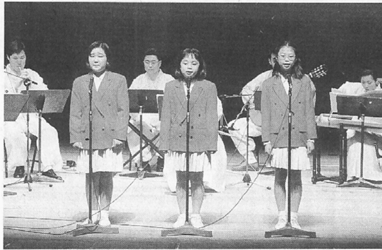
◇지난 28일 열린 오느를 실내악단의 공연 장면.

씨에 의해 소개돼 박수를 받았다. 이날 공연에는 오느를 실내악단 외에도 조계사청년회 보리수합창단과 대한불교어린이합창단 단원이 출연했다. 승무, 법고춤과 찬불가, 창이 조화를 이루며 진행된 이날 공연은 '찬불가의 새로운 장르 개척의 서곡을 열었다.'는 평가를 받았다.