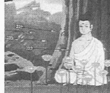
◇북한불교의 어제와오늘 (3일 12:30~13:20) 남북한의 교류가 확대되고 있는 상황에서 북한불교의 현주소를 조명해본다.

btm 우리들의 부처님(1일 오후2시20분~35분) 부처님 일대기를 애니메이션 실사로 제작한 어린이 교육용프로.