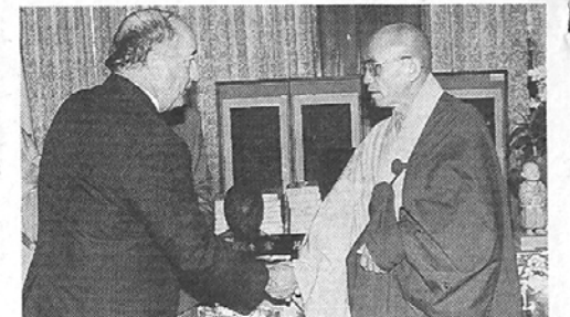
맥 윌리엄스 호주대사는 지난 10일 오전 10시 조계종 총무원을 방문하는 자리에서 한·호 문화교류에 불교계가 앞장 서 줄것을 당부했다.

동국대 불교대학원 제4대 목정배원장 취임식이 지난 7일 오후 6시 엠버서더 호텔 2층 그랜드볼룸에서 성료됐다.