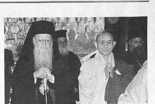
세계적으로 3억 신도를 보유하고있는 정교회 총대주교 비르톨로메우스 1세가 지난 10일 조계종 월주 총무원장을 방문, 조계사 대웅전에서 함께 참배드리고 있다.

대중에게 법문을 설한 서암스님은 "법생 받은 부처님 은혜를 갚기 위해 불법을 접하지 못한 이들을 찾아 포교하겠다"고 밝혔다.