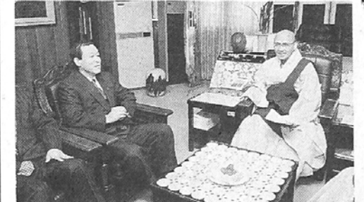
오인환 공보처 장관은 지난 11일 유세준 기획관리실장, 서종한 신문방송국장, 유재용 방송행정과장과의 함께 월주 조계종 총무원장을 예방 부처님 오신날 행사의 행정적 지원을 적극적으로 하겠다고 말했다.

전국교법사단(단장 김종환)은 지난 8일 동국대 정각원에서 종립학교장 및 전국교법사들이 참석한 가운데 창단 4주년 기념법회 및 세미나를 가졌다.