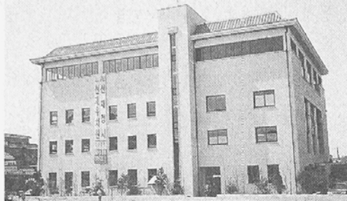
△안산시지역 포교의 전초기지 역할을 할 선재정사가 지난달 26일 정식 개원했다.