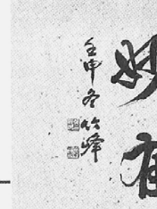
▷문수사 중창·노인돕기 기 공로품 황선민작 '진공묘유'