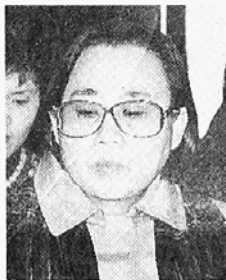
이 환희로운 불사가 바로 불자들의 긍지가 아니겠나

는 생각합니다. 다매체 시대를 이끌어 갈 방송 포교의 원력이 이제 그 첫 결실을 맺었으니 앞으로의 활약에 기대가 큼니다.