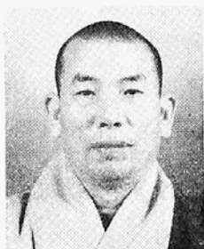
불자들이 더불어 불교TV 개국을 축하합니다.

이제 우리에게 남은 일은 불교텔레비전이 제 몫을 다하도록 힘을 보태 주는 것이라 생각합니다. 시청각 포교의 효과는 생각이상으로 큰 것이며 그 효과는 바로 우리들의 자양분이 될 것이기 때문입니다.