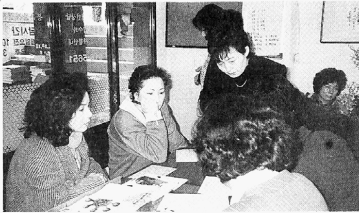
◇ 결혼상담실은 신뢰를 바탕으로한 성실한 상담으로 불자가정 이루기에 최선을 다하고 있다.