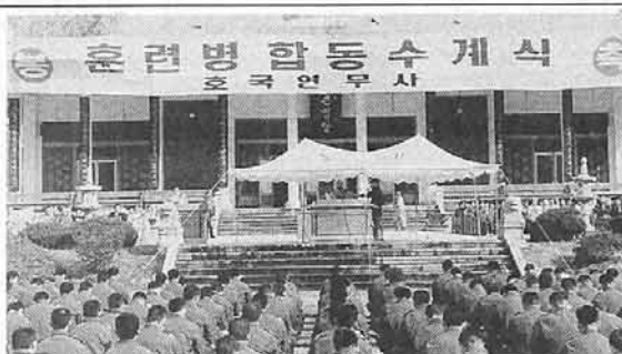
연병장 가득 들어선 논산훈련소 훈련병들, 불교어머니회의 주선으로 귀한 불자의 인연을 맺고 있다.

리 퍼서 밝은 마음, 명랑생활의 불국정토를 실현하기 위해 1979년 창립했다. 자비롭고 평등한 부처님의 가르침을 사회에서 몸소 실천하고자 하는 불교어머니회는 소외되고 어두운 곳을 찾아 꾸준히 봉사활동을 해왔다. 불교어머니회는 교도소와 구치소