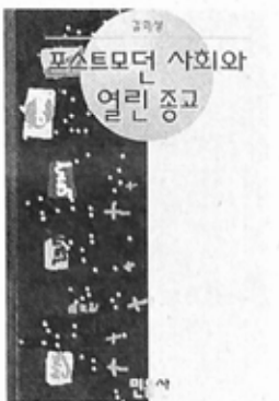
조계종 분류와 개혁을 다루고 있는데, 그는 3.29 조계사사태를 보며 '불교개혁에 앞서, 지도적 승려들이 권력과 재물과 명예욕으로 해서 얼마나 썩어있고 얼마나 부처님의 정법을 호리고 있는가를 생각하지 않을 수 없다'고 개탄하며 '비극'을 넘어서는 승려들의 합력을 촉구하고 있다.

그러나 개혁의 모든 것이 승가에만 쏠려질 문제는 아니다. 해결은 불교인 모두의 몫임을 지적한다. "우리 스스로가 자신의 책무와 의무를 성실히 다하여 행할 때, 그리고 자비와 자혜의 삶을 통해 산업을 쌓아갈 때 비로소 우리는 기쁨으로 충만한 사회를 만들 수 있을 것"이라고 강조한다. 불교인들 스스로 자신의 신앙태도를 되돌아보는 일에서 변화는 비롯된다는 점을 일깨운다.