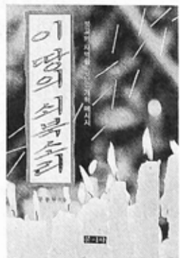
개혁을 촉구하는 불서들은 미래사회에 대응할 불교의 모습을 그리고 있다는 점에서 일종의 불교이해학으로 읽힌다.